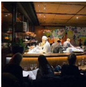
Les odeurs de cuisine