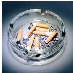
Les odeurs de tabac